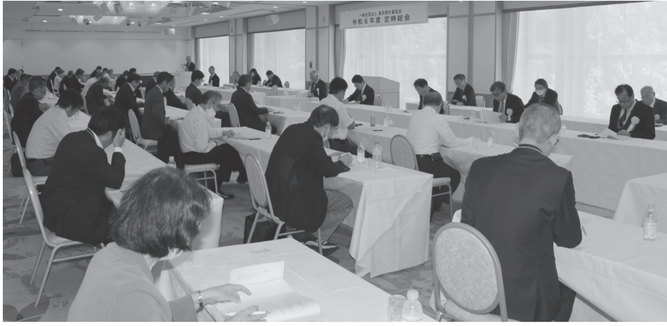
東京都計量協会令和6年度定時総会のもよう。

一般社団法人東京都計量協会は、2024年6月11日(火)に令和6年度定時総会を開催した。 ◇定時総会次第 日時：令和6年6月11日(火)、午後2時～午後5時30分 会場：ホテルグランドヒル市ヶ谷(東京都新宿区市ヶ谷本村町4-1) ▽議長選出 ▽議事録署名名人の選定 ▽議事 I. 審議事項 第1号議案 ・令和5年度事業報告書承認の件 第2号議案 ・令和5年度決算報告書承認の件 第3号議案 ・補欠のための理事選任について II. 報告事項 1. 令和6年度事業計画書について 2. 令和6年度収支予算書について III. その他 ▽来賓祝辞 ▽閉会 (次ページへつづく)