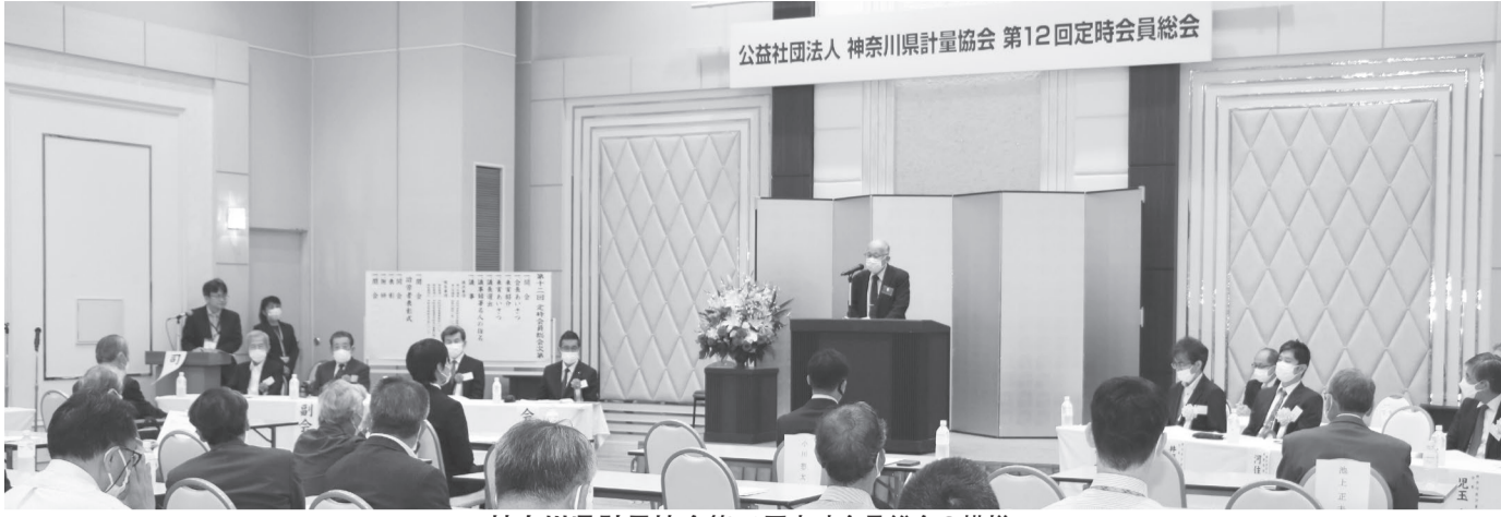
神奈川県計量協会第12回定時会員総会の模様。