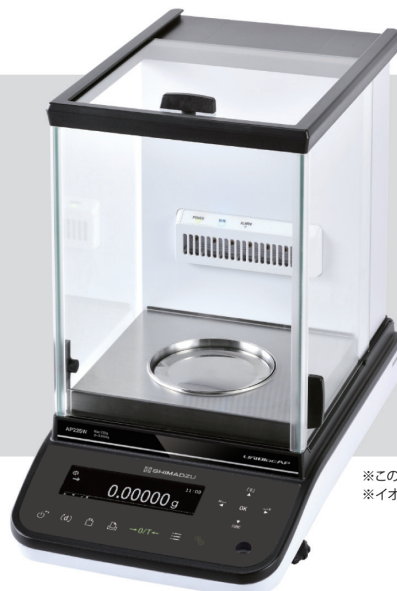
※この写真はAP225Wです。 ※イオナイザはオプションです。