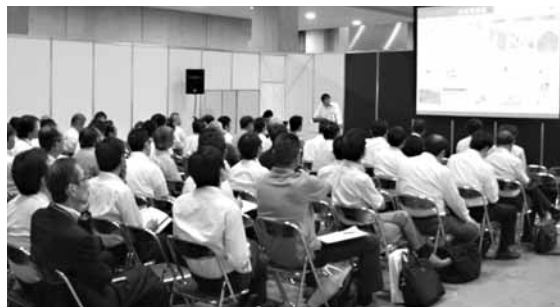
新製品・新技術セミナーが連日ひらかれる