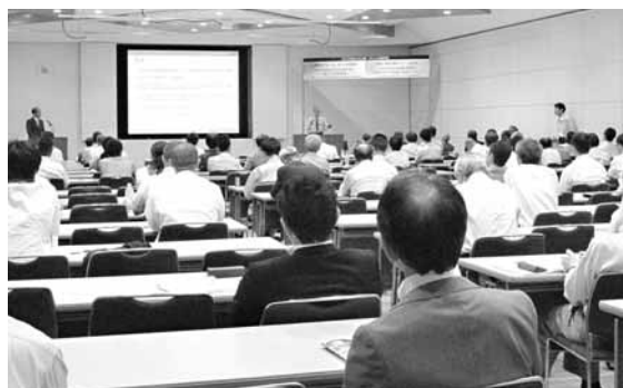
記念講演会のようす (インターメジャー 2016)

大和製衡株式会社 tel:078-918-6577 http://www.yamato-scale.co.jp/